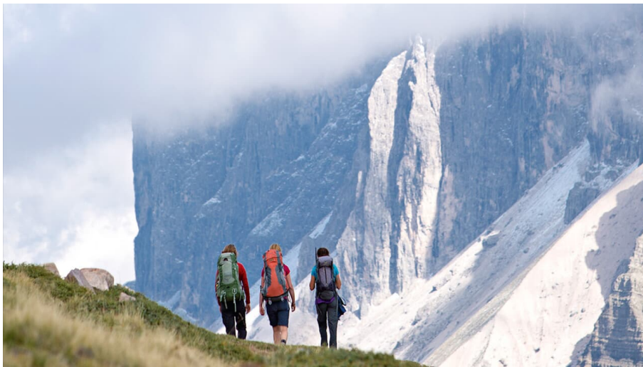
Curona de Gherdëina Etappe 2 - © Jens Klatt