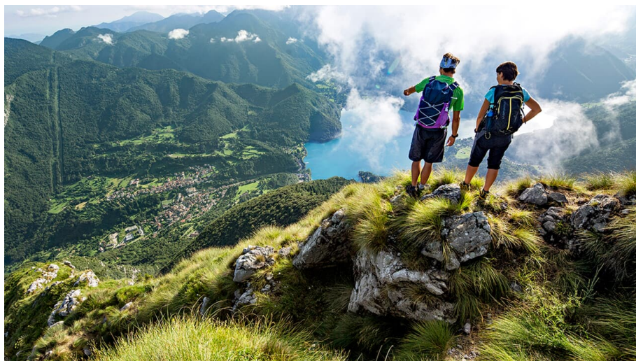
Ledrosee: Auf den Hausberg Cima d'Oro (1802 Meter)