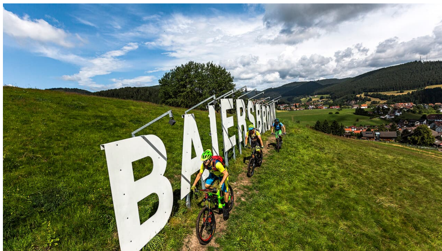
Baiersbronn: Klosterreichenbach - © Andreas Kern