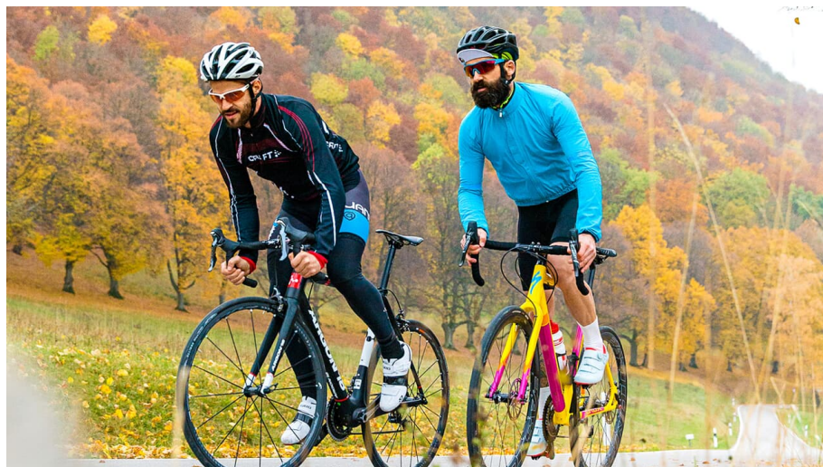
Schwäbische Alb: Donautalrunde