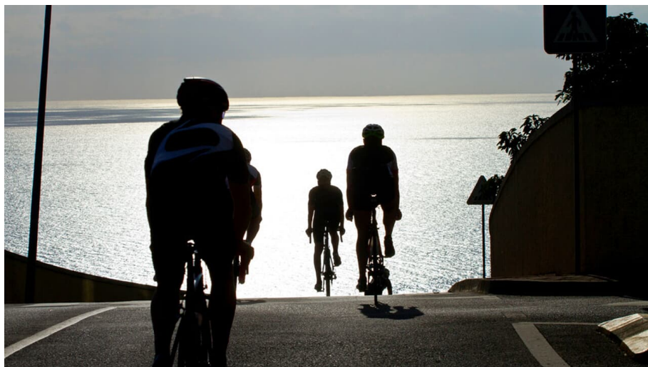
Rennrad-Kreuzfahrt Tour 3: Teneriffa