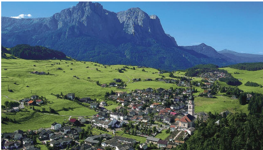
Seiser Alm - Nach Brembach und zurück