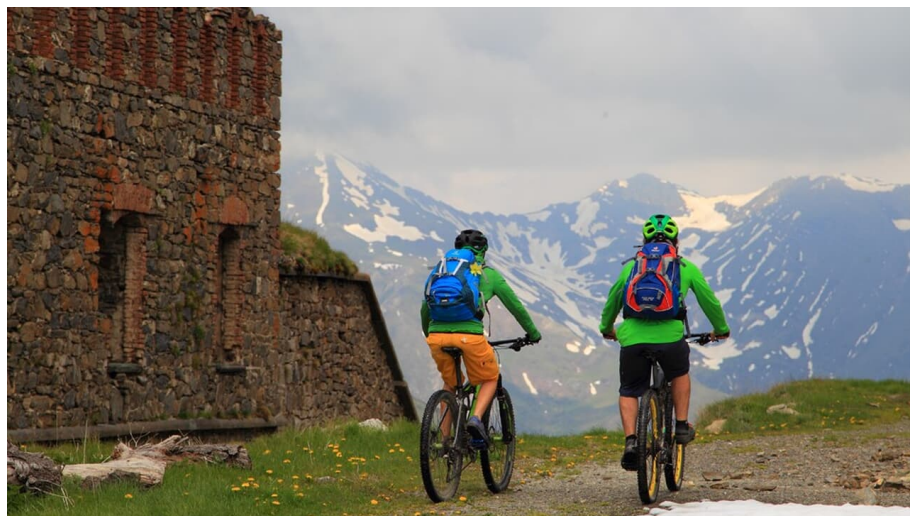
Ligurischer Grenzkamm