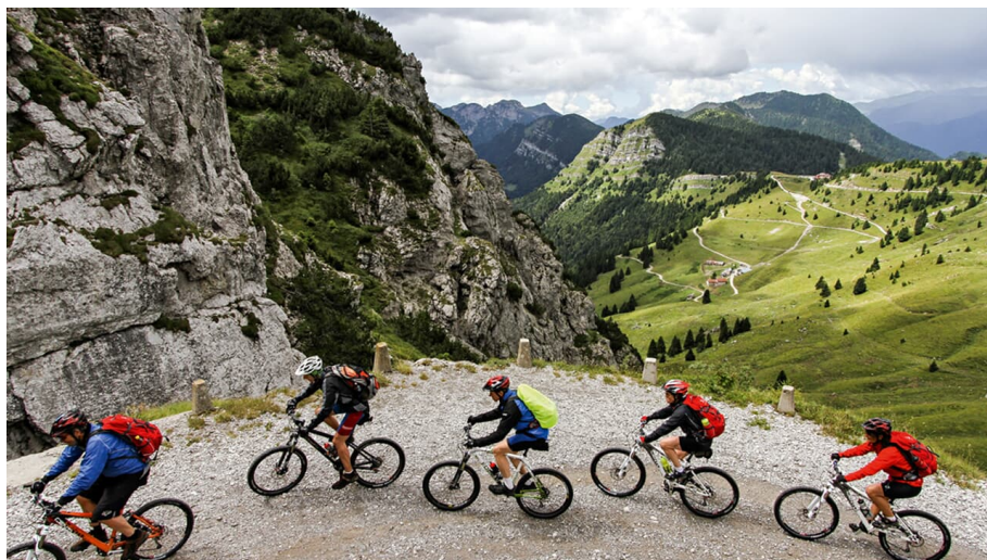
Monte Caplone