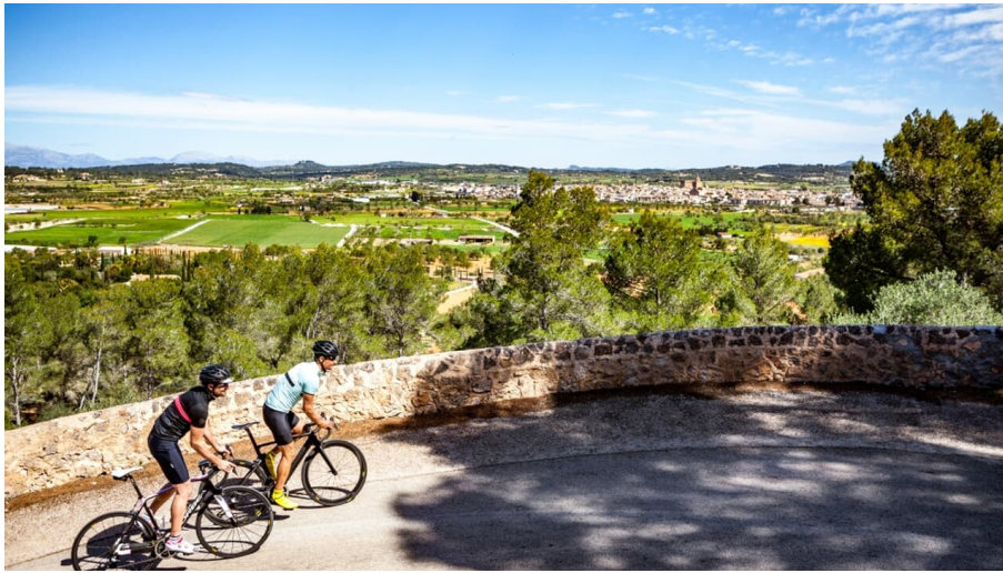
Mallorca Rennrad-Tour 1: Zur Ermita de Betlem