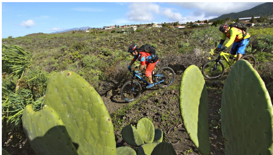
La Palma: MTB-Tour zur Südspitze