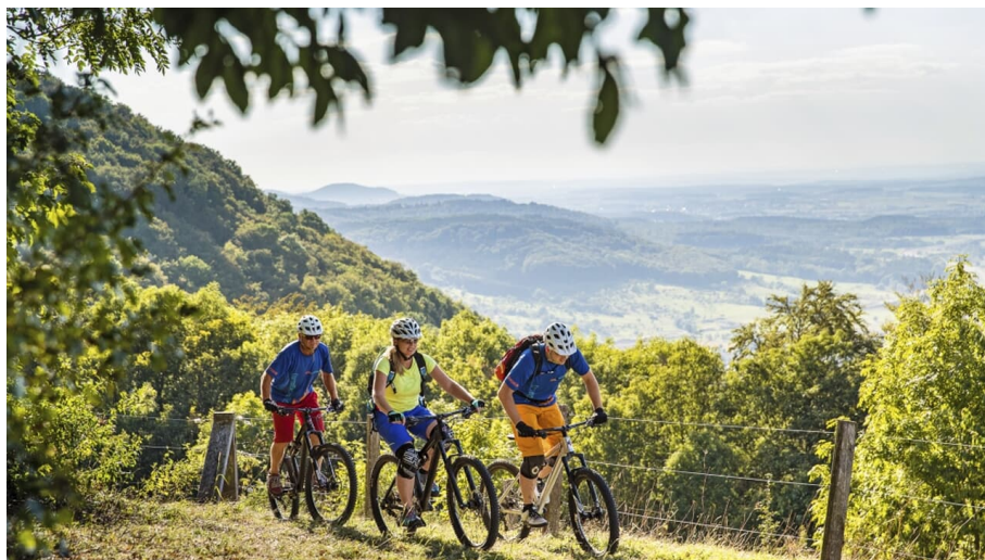
Schwäbische Alb: MTB-Goisatälesrunde