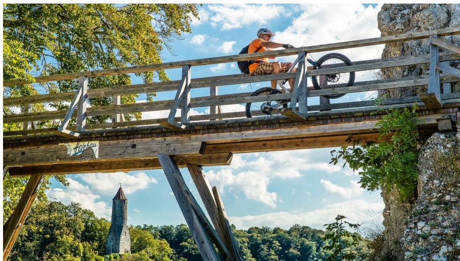
Schwäbische Alb: MTB-Tour de Ländle - © Björn Hänsler