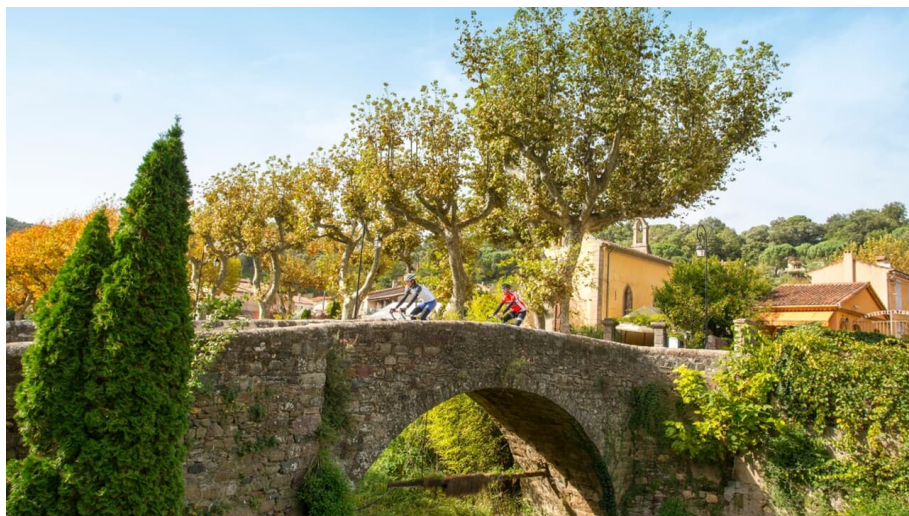
Côte d'Azur: Klettern im Massif des Maures