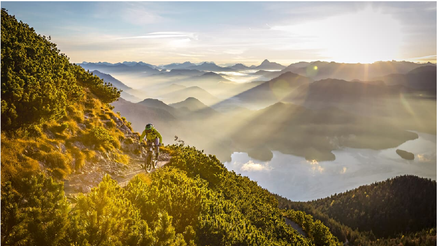
Herzogstand - © Adrian Greiter