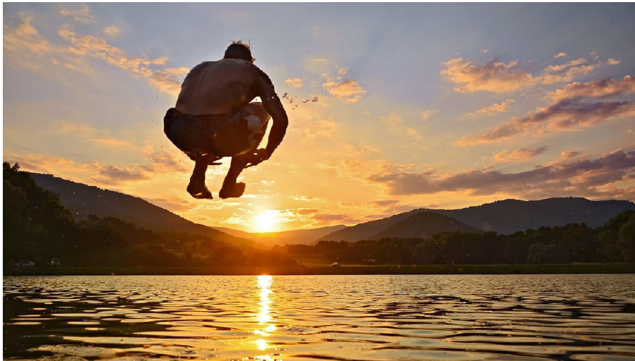
Die besten Seen für Mountainbiker: Der Montiggler See