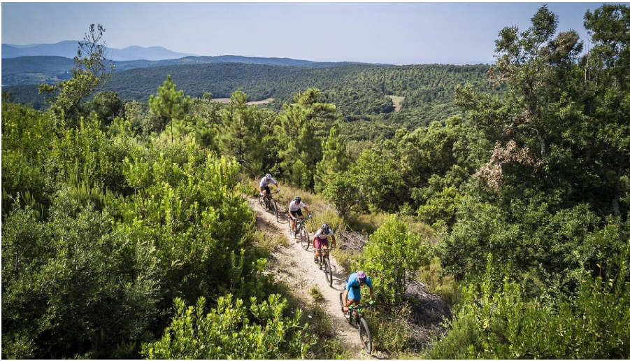
Mass Family - © Adrian Greiter