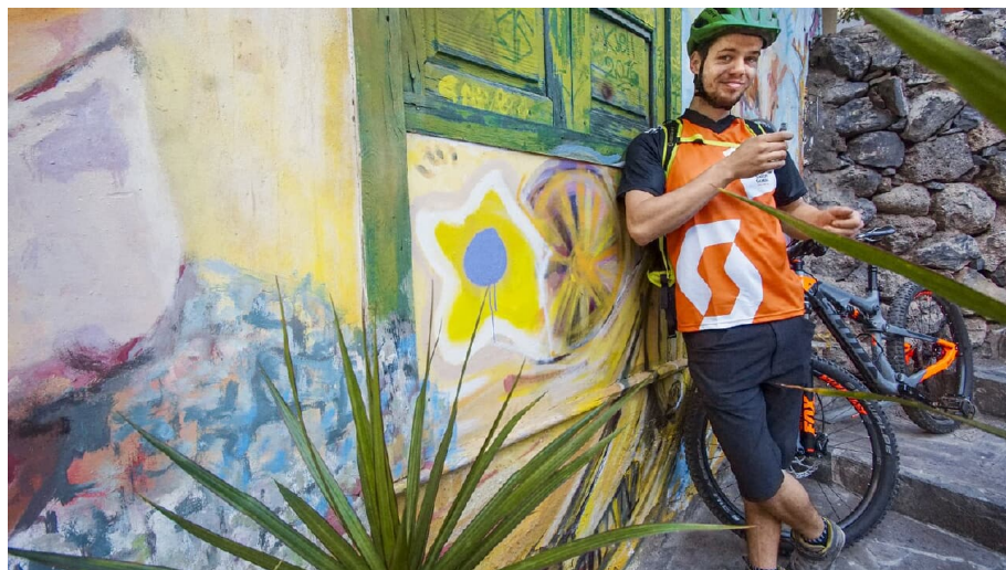
Pajarito - © Gerhard Eisenschink