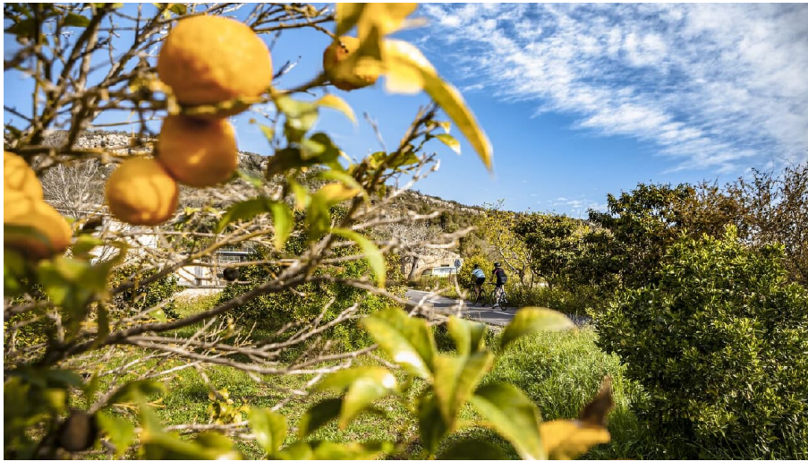
Sant Salvador - © Christian Lampe