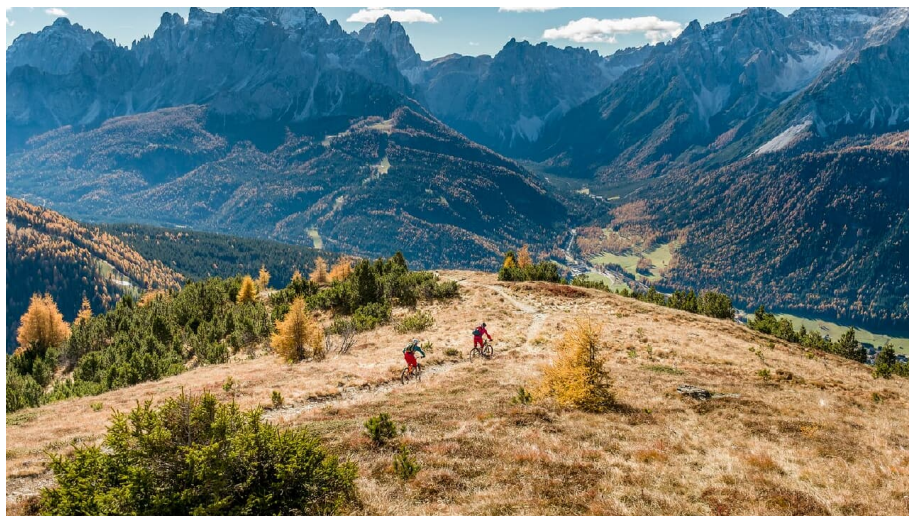
Brückentagsplaner: Hochpustertal-Tourenvorschlag