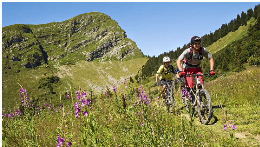
Brückentagsplaner: Portes du Soleil-Tourenvorschlag