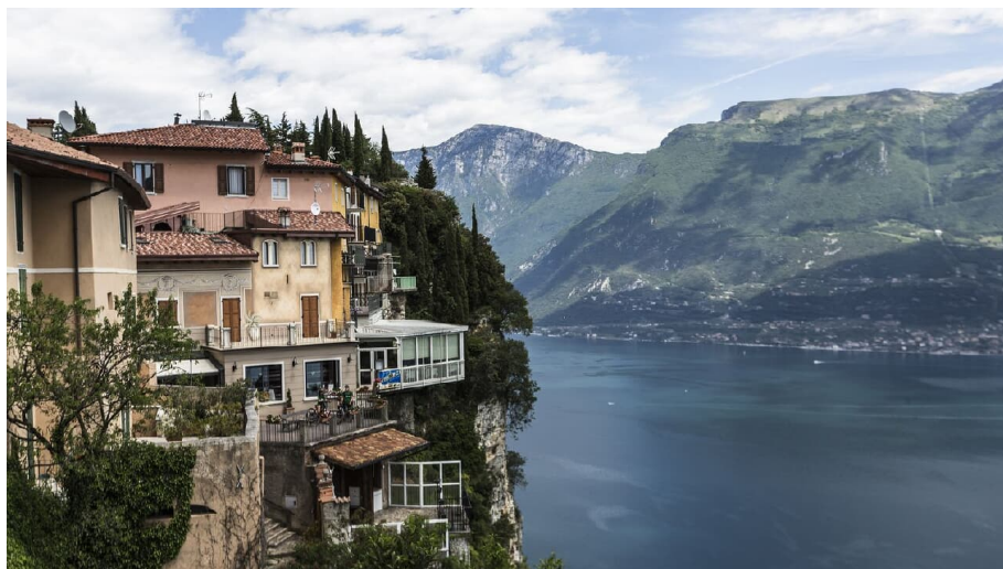
Valle del Singol - © Andreas Kern