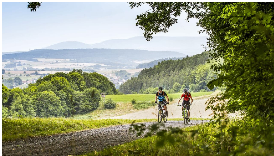
Milseburg - © Ralf Schanze