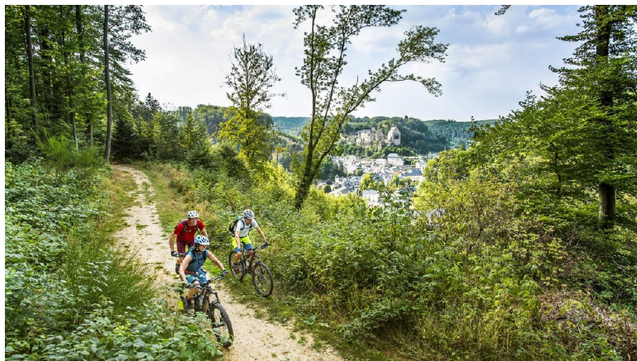
Aesbachtal - © Ralf Schanze