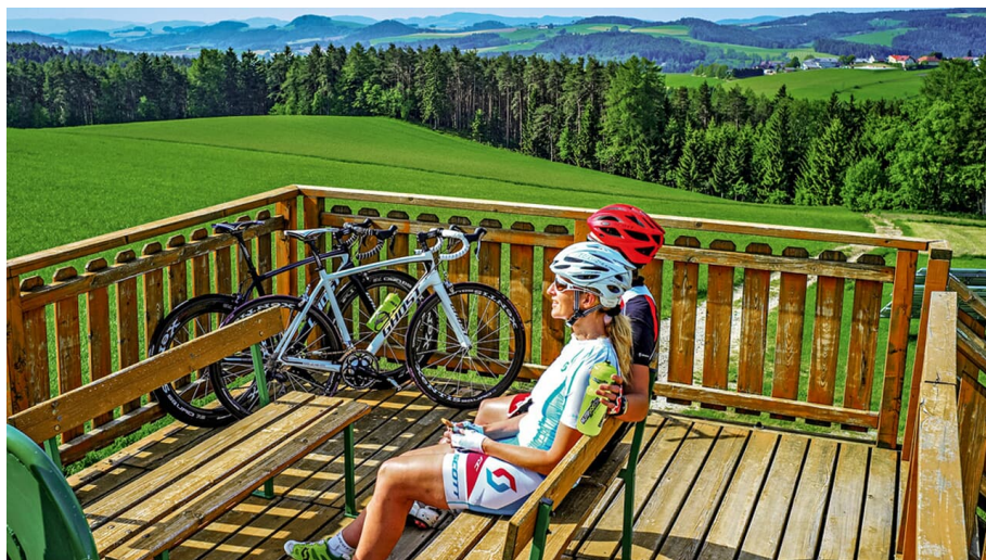
In die Oststeiermark