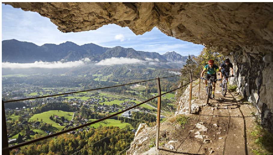
Salzkammergut Trophy