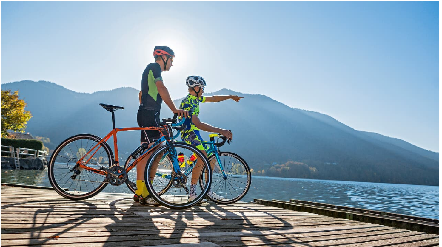
rb-0318-hm_stadtsalzburg_014 - © Heiko Mandl