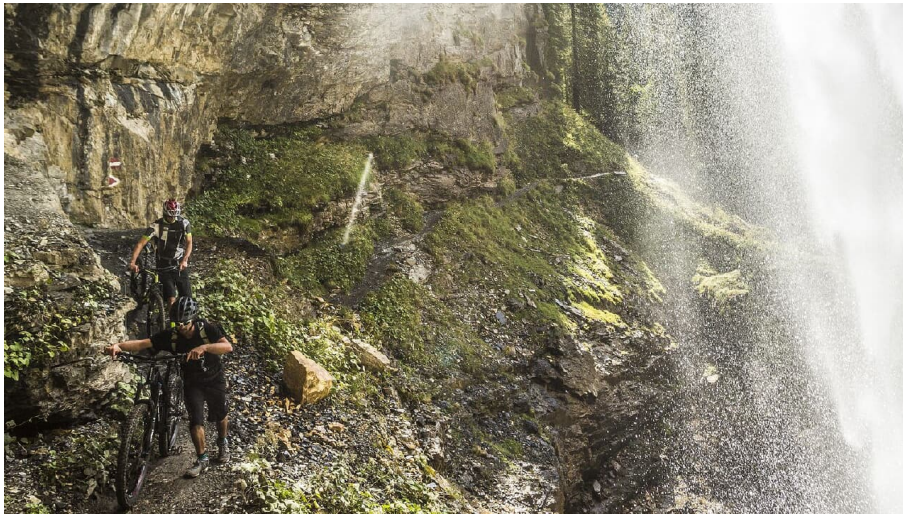
Brückentagsplaner: Flachau-Tourenvorschlag