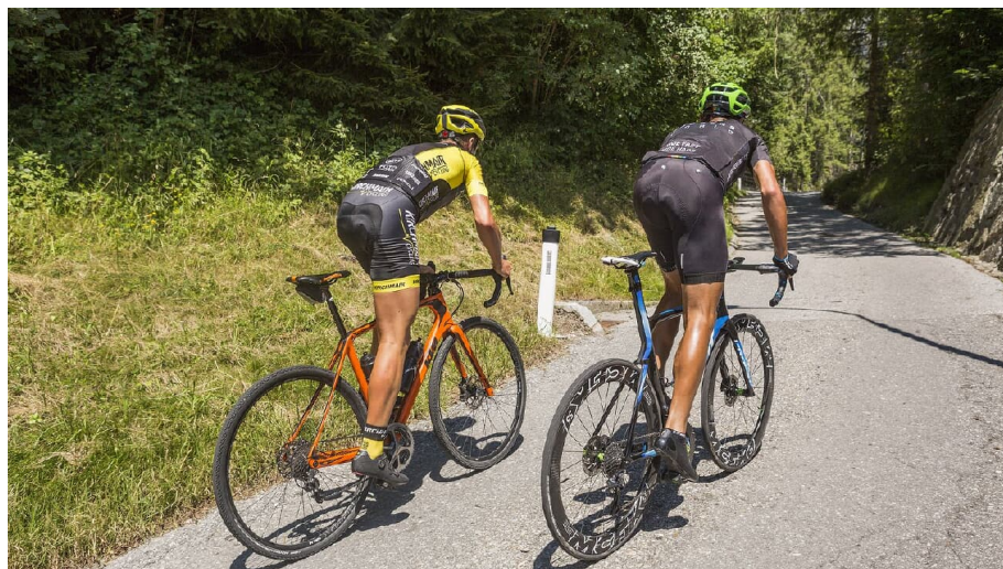
Auf den Spuren der WM