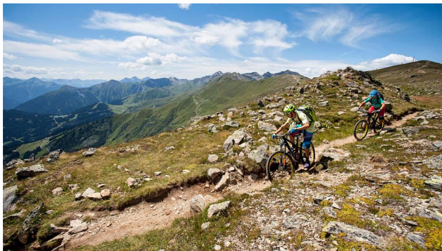
Serfaus-Fiss-Ladis: MTB-Tour Frommestrail