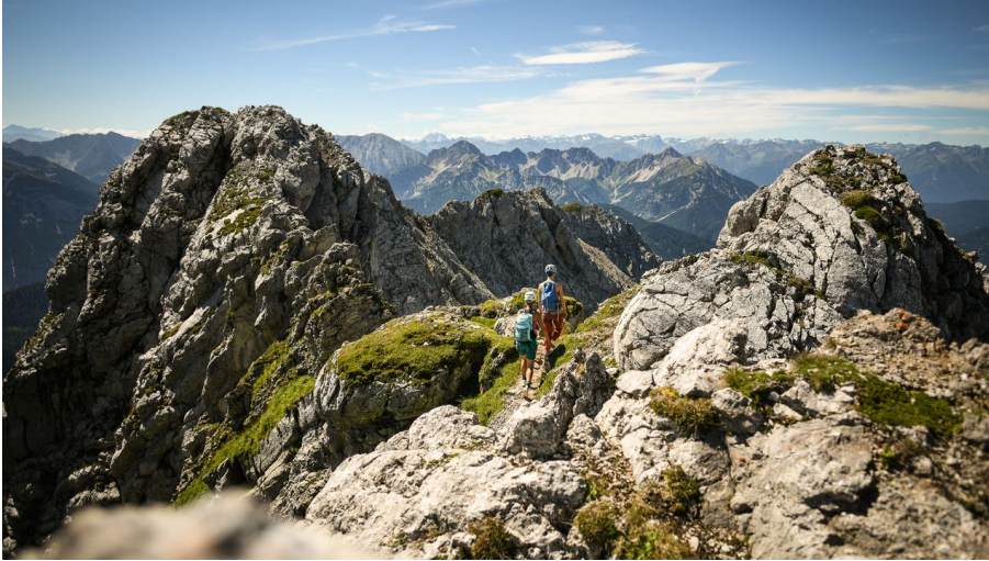
Aussicht am Mittenwalder Klettersteig