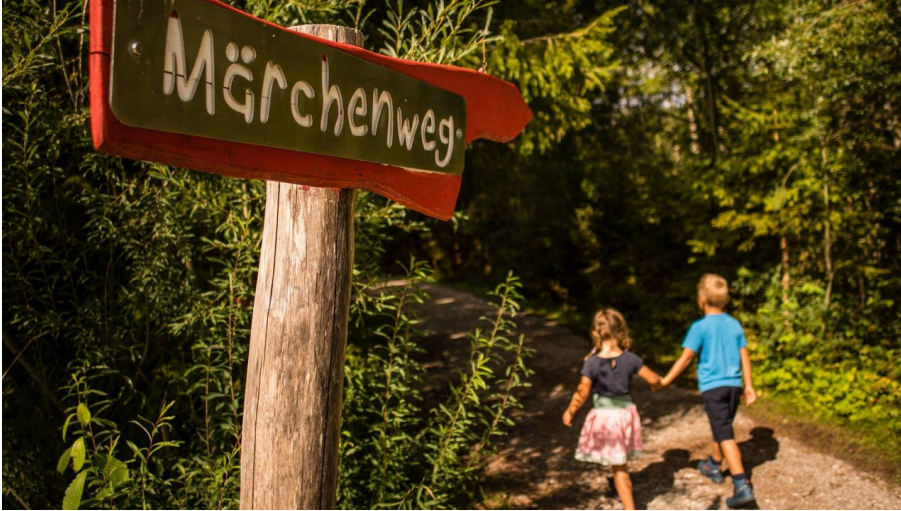
Start zum Wallgauer Märchenweg