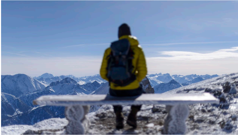
Winterliche Aussichten auf dem Karwendel