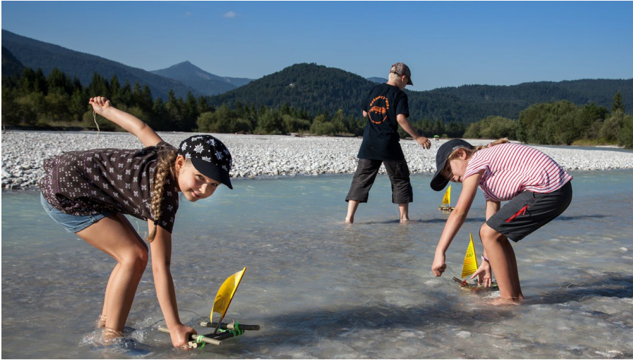
Kinder an der Isar bei Wallgau