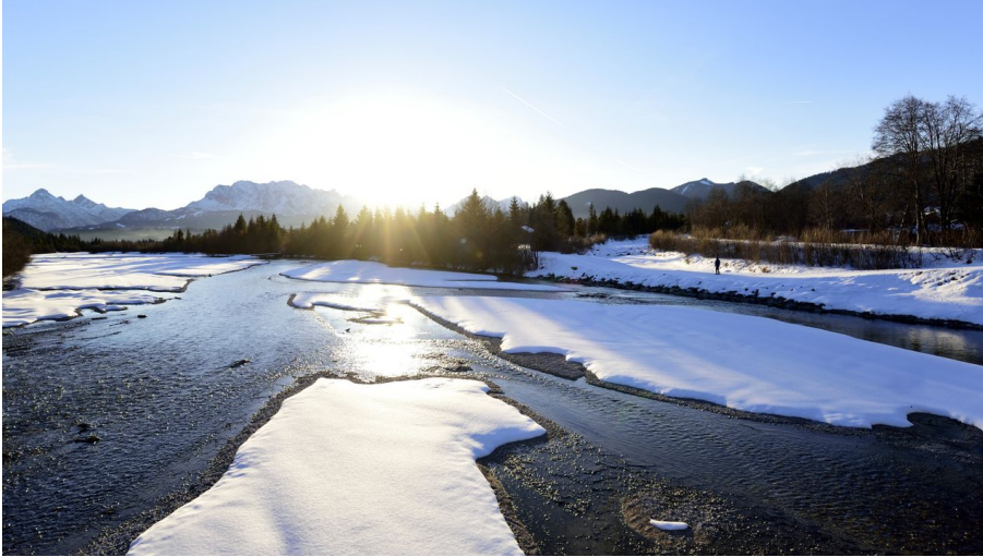
Isar Wallgau