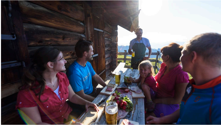
Krüner Alm Einkehr - © Alpenwelt Karwendel | Wolfgang Ehn