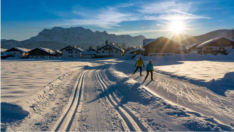
Langläufer an der Isarfeldloipe in Wallgau