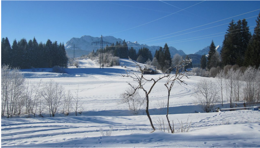
Loipe Krün