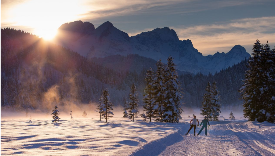
Skating auf der Genussloipe - © Alpenwelt Karwendel | Weiermann&Kriner