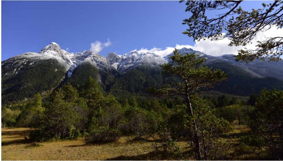
Mittenwald Riedboden