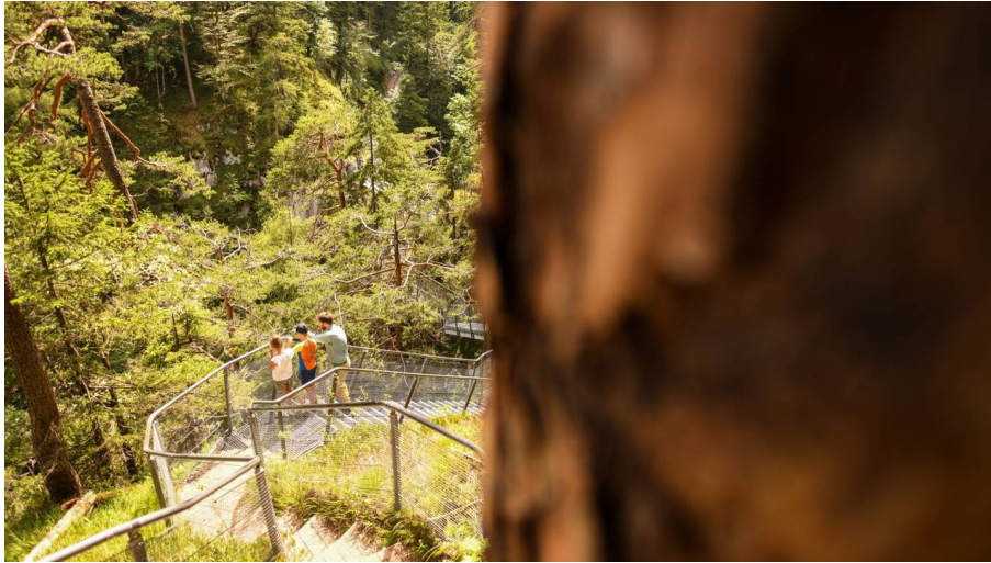
Unterwegs in der Leutascher Geisterklamm bei Mittenwald