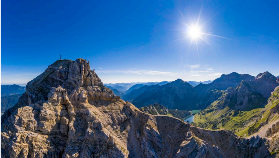
Schöttlkarspitze mit Blick Richtung Soiernsee - © Alpenwelt Karwendel | Kriner&Weiermann