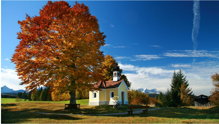
Buckelwiesen Maria Rast