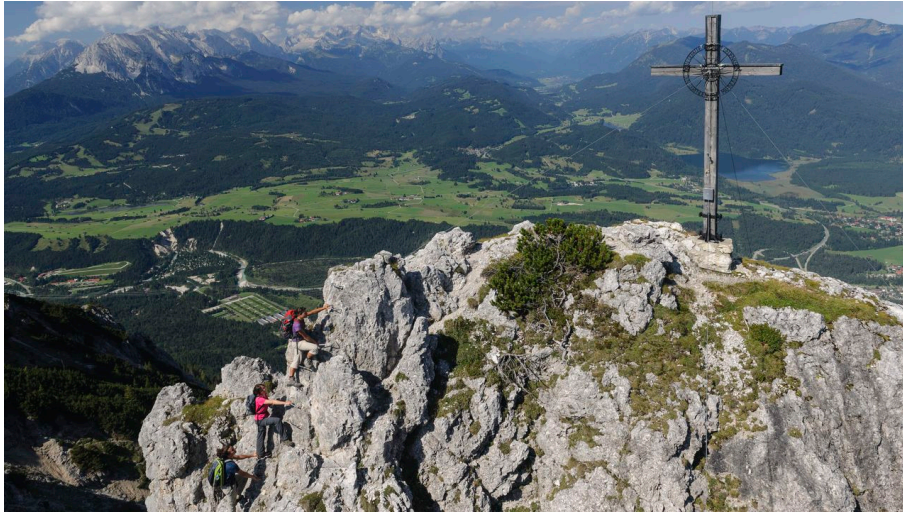
Gipfelkreuz Signalkopf