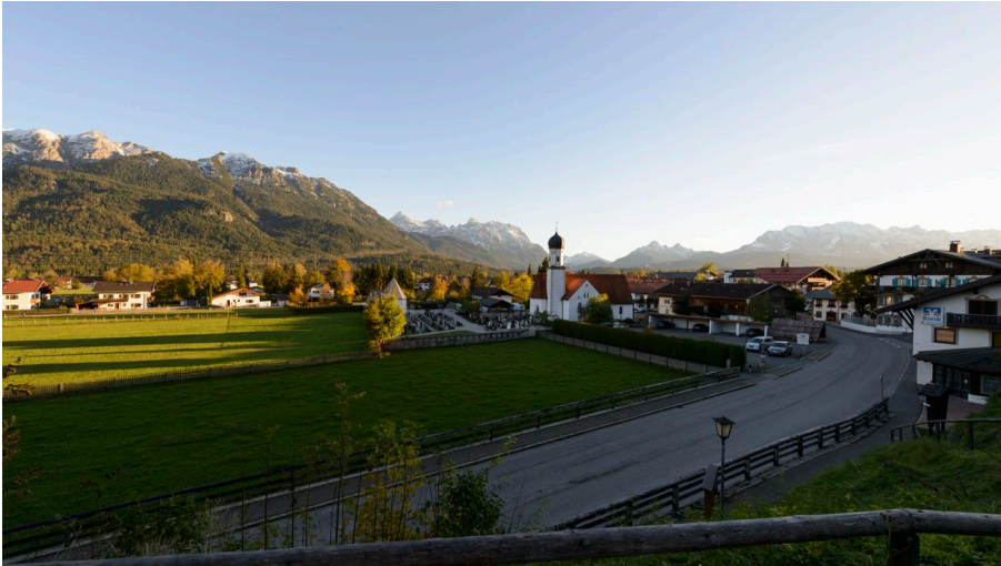
Ortsansicht von der Wallgauer Sonnleiten