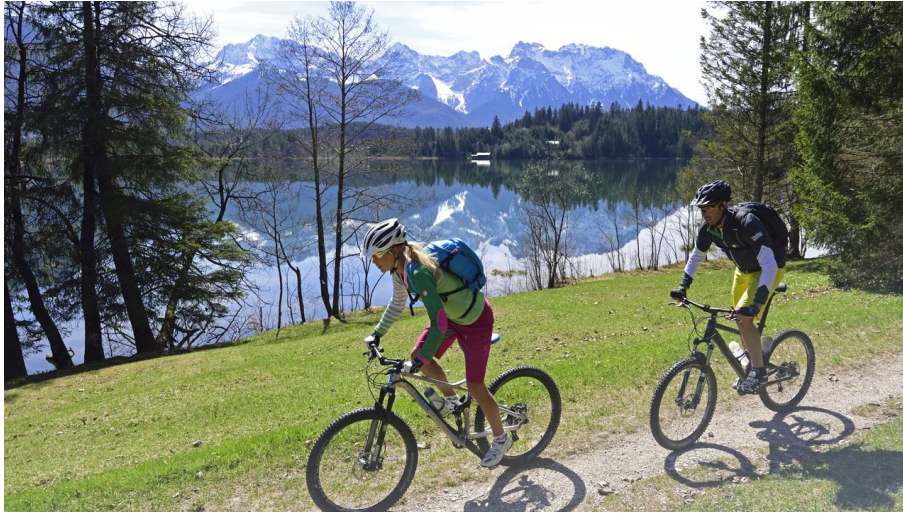
Barmsee mit dem Bike