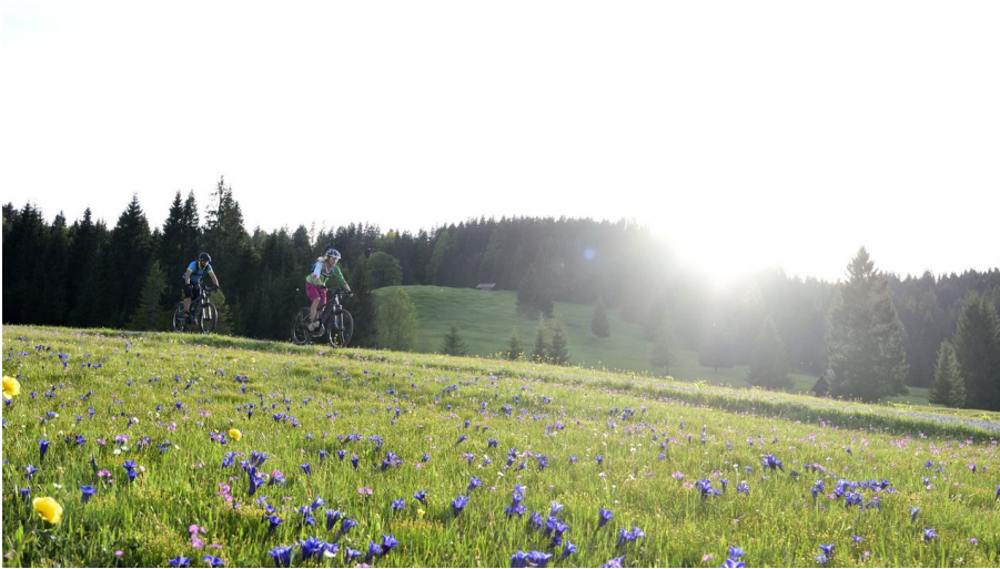
Biken im Frühling