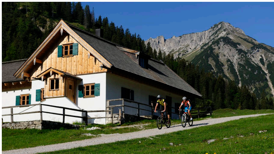
Mountainbiker an der Vereiner Alm