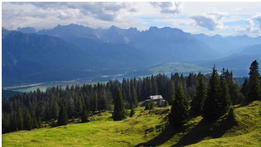
Wallgauer Alm