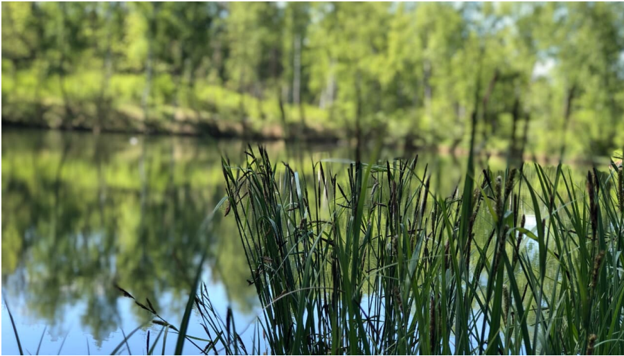
Reise ins Glück DonAUwald