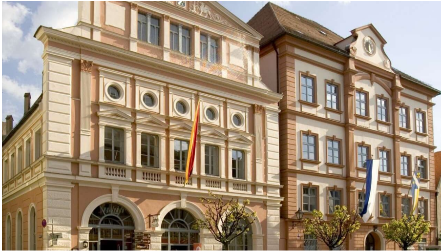
Rathaus Dillingen